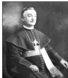
Papp Antal püspök

Papp Antal püspöknek két olyan intézkedése volt, melyeknek tragikus következményei lettek a Munkácsi Egyházmegye történetében: a betű- és naptárreform. Mindkettőt a magyar kormány sürgette.